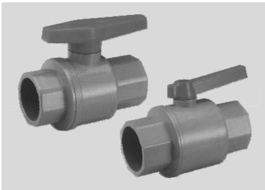
PVC凡而單把手 (加強型)