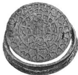
人 孔 蓋