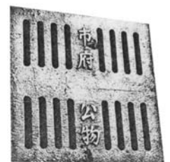
水 溝 蓋