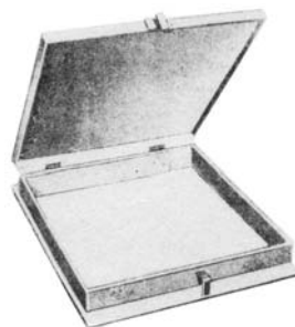
屋頂水箱鑄鐵蓋(附加鎖孔)